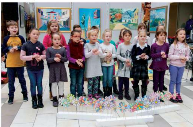
Pevski zbor IV. OŠ Celje