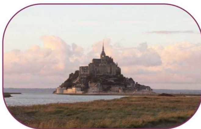
Cerkev Mont Staint Michel (S Francija)