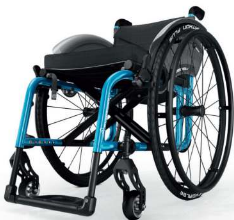
Zložljiv aktivni invalidski voziček AVANTGARDE