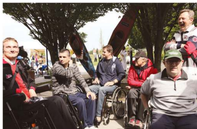
Druženje različnih invalidskih društev