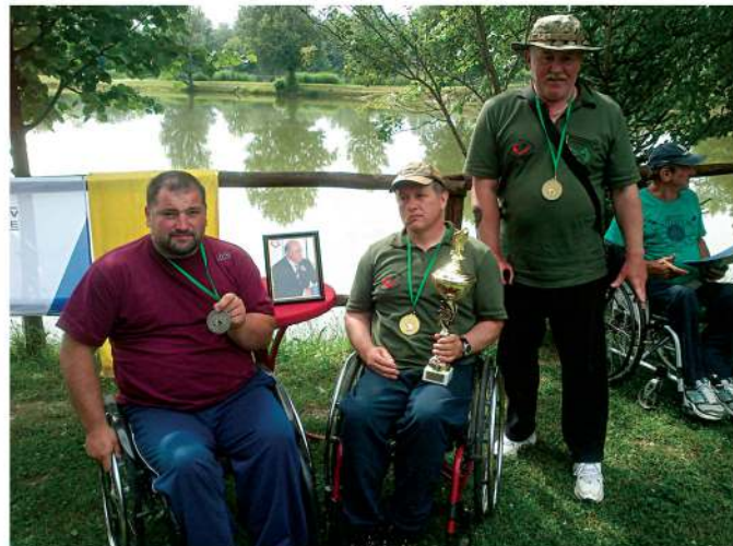
Zaključek ribolovne sezone