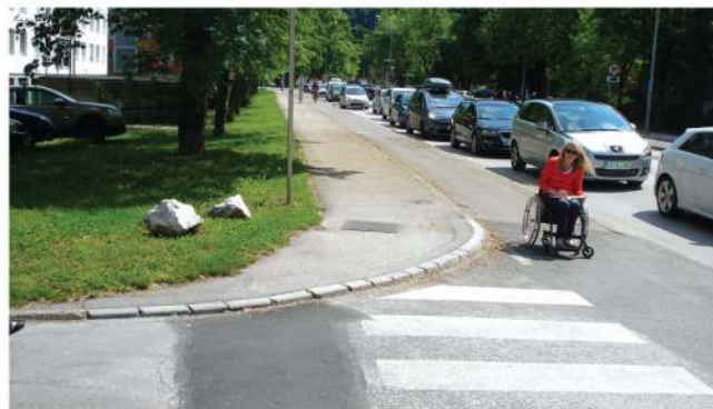
Neurejeni pločniki in prebodi

Po končani predstavitvi je podal priporočilo, da preventivno obiščemo urologa, vsaj enkrat na dve leti in opravimo ultrazvok sečil ter morebitno preiskavo urodinamike. Nato pa je bil na voljo za vprašanja, ki smo jih člani, kar pridno postavljali.