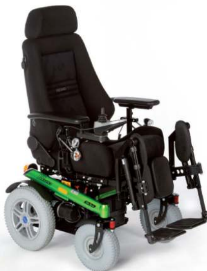
Voziček na elektromotorni pogon B400 | B500 | B600