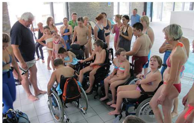
Otroci so res uživali