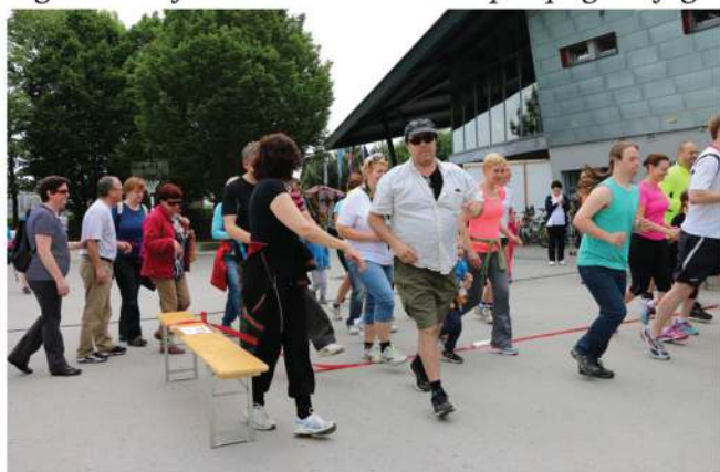
Tečem ali hodim, da pomagam

Tečem ali hodim, da pomagam, je vseslovenska dobrodelna prireditelja Lions klubov Slovenije, ki se odvija tekom maja po različnih krajih Slovenije. Naše društvo se je udeležilo celjske prireditve, ki so jo v Kajakaškem centru na Špici v Celju organizirali Lions klub Celje, Keleia, Mozaik in Žalec ter Leo klub Mavrica in Celjski vitezi. Tako kot drugod po Sloveniji, so tudi v Celju udeleženci tekli ali hodili v dobrodelne namene. Štartnina udeležencev se je namreč v celoti namenila invalidskim organizacijam. Posebnost teka je, da se zadnji metri pretečejo ali prehodijo z zavezanimi očmi, rezultat ni pomemben, ampak je važna udeležba. S tem se udeleženci srečajo z občutki, ki jih imajo slepi ljudje. Sicer pa so se na prireditvi v Celju predstavila invalidska društva Sonček, Medobčinsko društvo slepih in slabovidnih Celje, Društvo gluhih in naglušnih Celje in seveda tudi Društvo paraplegikov jugo-