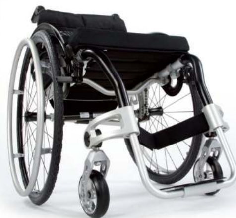
Fiksen aktivni invalidski voziček BLIZZARD