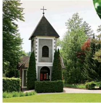
Čebelica na delu

Ogledali smo si veliko cvetočih trajnic in grmovnic, prav poseben je bil zeliščni vrt, ki je v središču parka. V tem času so imeli razstavljenе skulpture, kot so avtomobil, letalo, kanglico za zalivanje v velikosti dveh metrov iz žice zavite s trstiko. V parku je tudi razgledni stolp, ki v višino meri približno 20m. Nanj so se povzpeli predvsem naši spremljevalci in nam z vrha sporočili, da je razgled odličен. Stolp žal nima dvigala in nam invalidom na invalidskih vozičkih ni dostopen. Zato pa so poti v parku lepo urejene in primerne za gibanje tudi z invalidskim vozičkom. Sredi ogleda smo si v senčnih koticah privoščili malo daljši postanek za malico. Med potjo po parku smo se ustavili pri cerkvi v kateri je zvon želja in na katerega lahko pozvoniš. Praviijo, da se ti izpolni vsaka želja. Videli smo tudi čevljarsko in kovaško