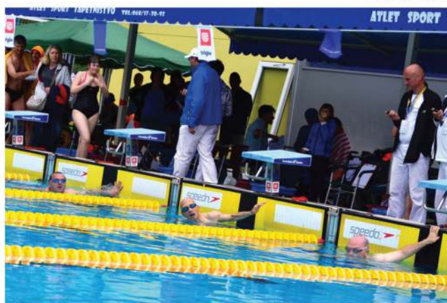
Zmagovalna ekipa našega društva